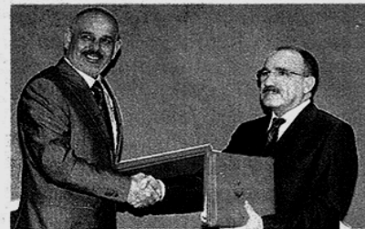
Minister Besir Atalay (r)

Turkije en Irak hebben vrijdag een veiligheidspact getekend waarin de twee landen overeenkomen samen 'terroristische activiteiten van de Turks-Koerdische rebellen te gaan voorkomen'. Dit heeft de Turkse minister van binnenlandse zaken, Besir Atalay, laten weten. De overeenkomst is ondertekend door de Turkse en