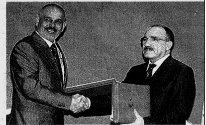
Minister Besir Atalay (r)

Turkije en Irak hebben vrijdag een veiligheidspact getekend waarin de twee landen overeenkomen samen 'terroristische activiteiten van de Turks-Koerdische rebellen te gaan voorkomen'. Dit heeft de Turkse minister van binnenlandse zaken, Besir Atalay, laten weten. De overeenkomst is ondertekend door de Turkse en